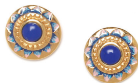
12--66320 Post 3 g - 1 cm 29 €