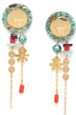
12--66522 Post 6 g - 6 cm 79 €