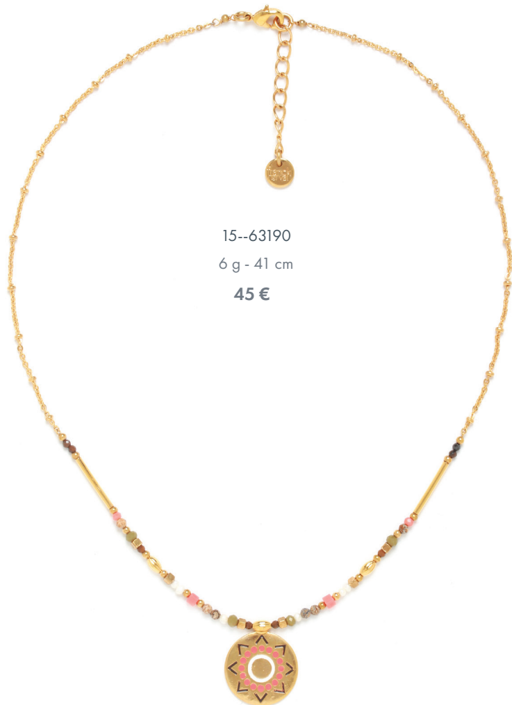
15--63190 6 g - 41 cm 45 €