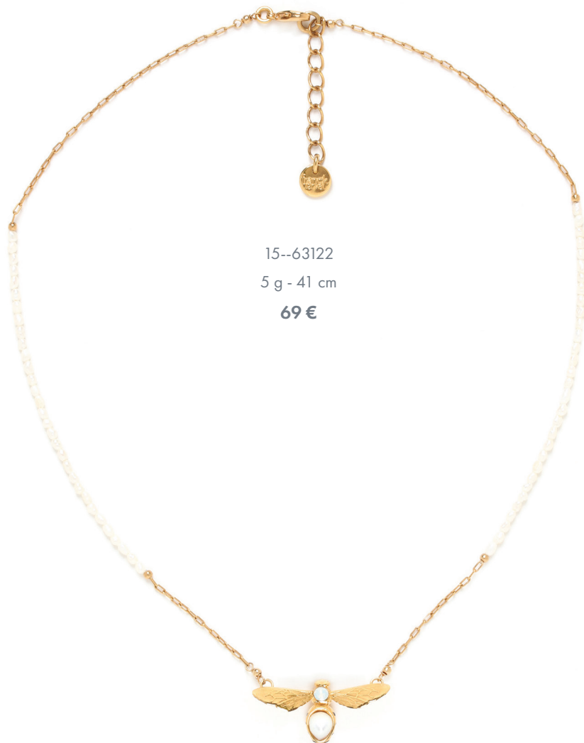
15--63122 5 g - 41 cm 69 €