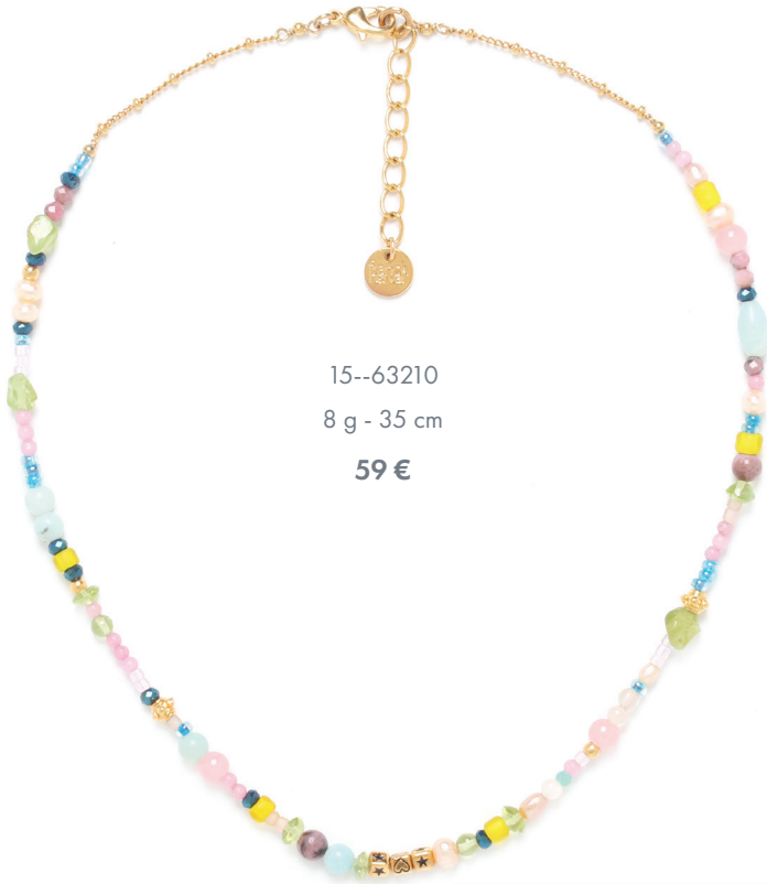
15--63210 8 g - 35 cm 59 €