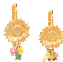
12--66482 Hook 6 g - 4 cm 39 €