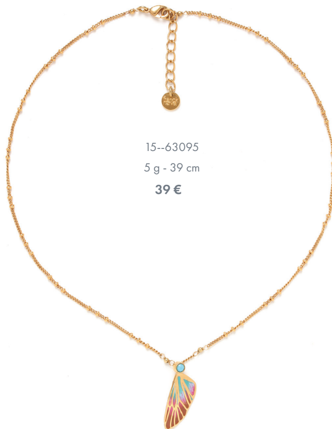
15--63095 5 g - 39 cm 39 €