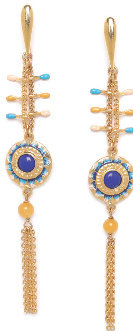
12--66331 Post 6 g - 9 cm 59 €