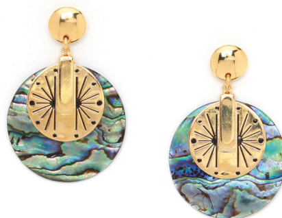
12--66445 Post 13 g - 4 cm 65 €