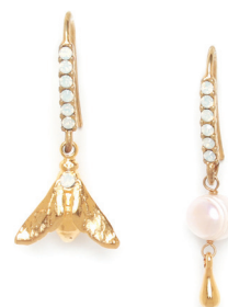
12--66368 Hook 4 g - 3 cm 39 €