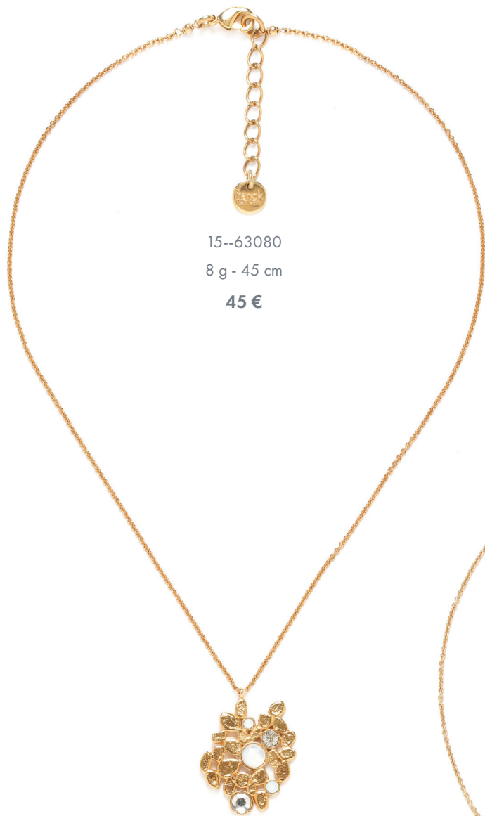
15--63080 8 g - 45 cm 45 €