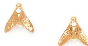
12--66410 Post 3 g - 1 cm 29 €