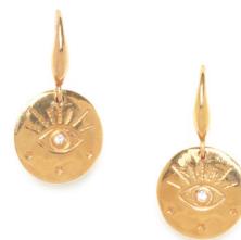
12--66283 Hook 4 g - 3 cm 29 €