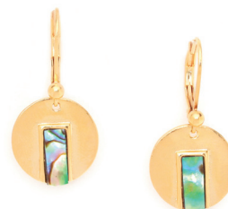
12--66443 Hook 4 g - 3 cm 25 €