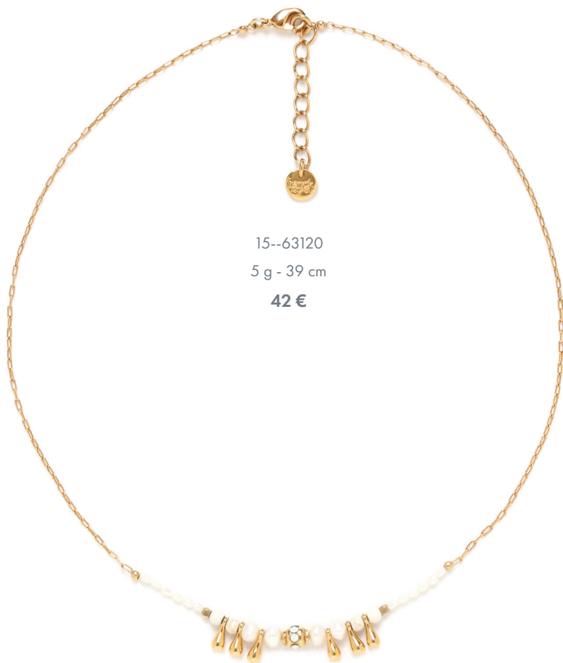
15--63120 5 g - 39 cm 42 €