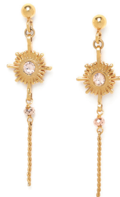
12--66289 Post 3.5 g - 6 cm 29 €