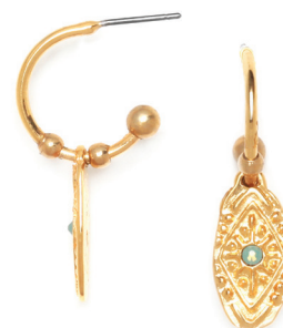
12--66378 Créole 5 g - 3 cm 39 €