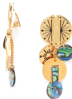
11--66440 Clip 13 g - 5 cm 75 €