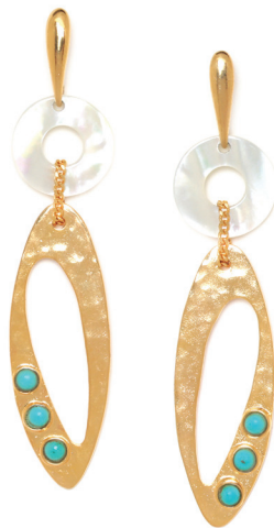
12--66464 Post 7 g - 7 cm 59 €