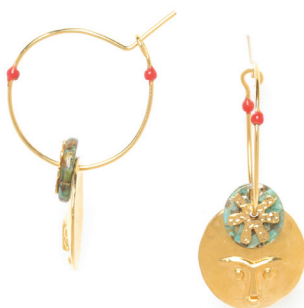
12--66529 Créole 5 g - 4 cm 55 €