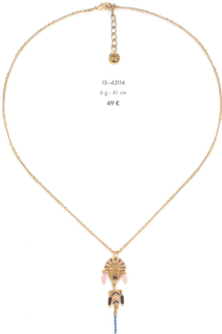
15--63114 6 g - 41 cm 49 €