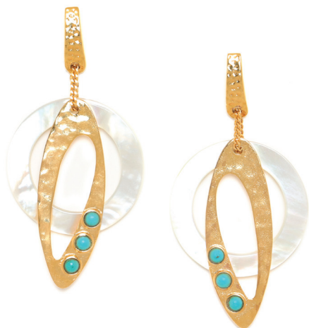
12--66468 Post 10 g - 6 cm 69 €