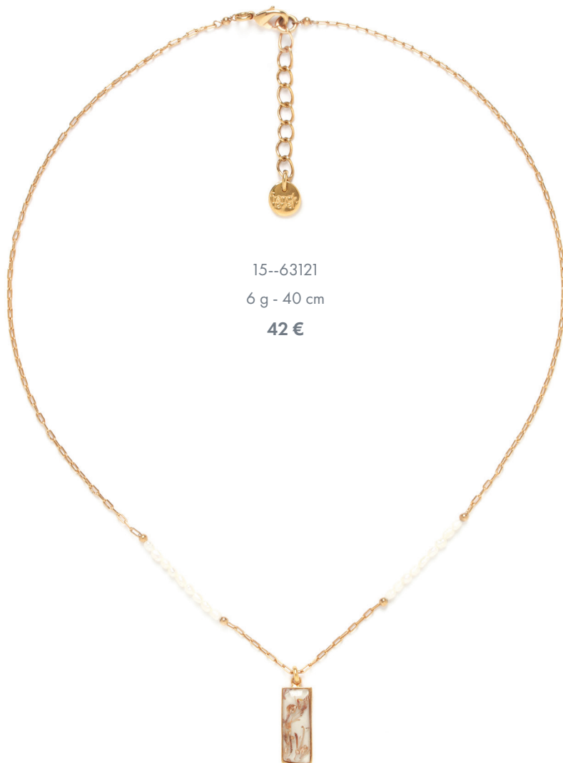
15--63121 6 g - 40 cm 42 €