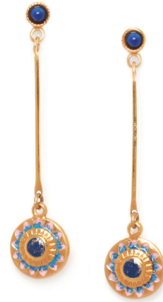
12--66329 Post 4 g - 5 cm 39 €