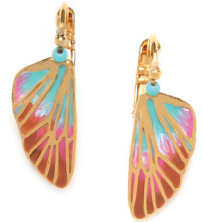
12--66272 Hook 3 g - 3 cm 42 €