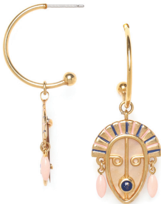
12--66323 Créole 7 g - 5 cm 59 €