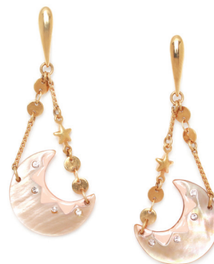
12--66290 Post 2.5 g - 5.5 cm 59 €