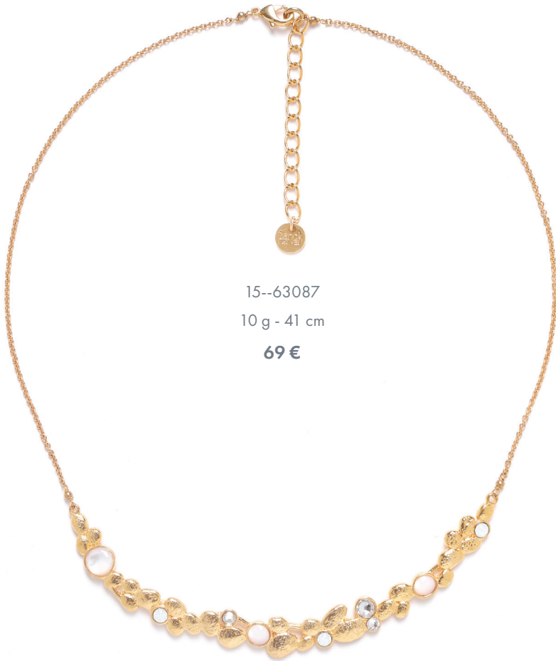
15--63087 10 g - 41 cm 69 €