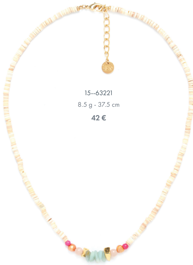
15--63221 8.5 g - 37.5 cm 42 €