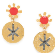
12--66530 Post 2 g - 2 cm 39 €