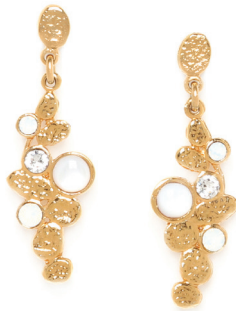
12--66241 Post 5 g - 3 cm 45 €