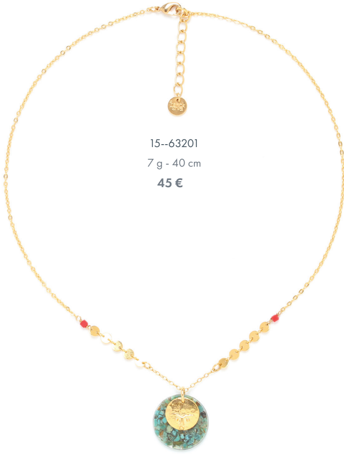
15--63201 7 g - 40 cm 45 €