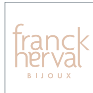
Sticker vitrine Window sticker 15x15cm