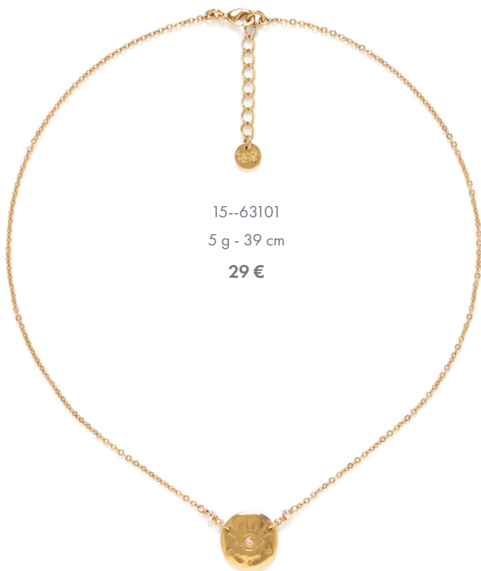
15--63101 5 g - 39 cm 29 €