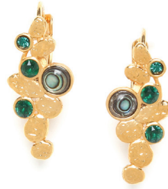
12--66257 Hook 5 g - 3 cm 42 €