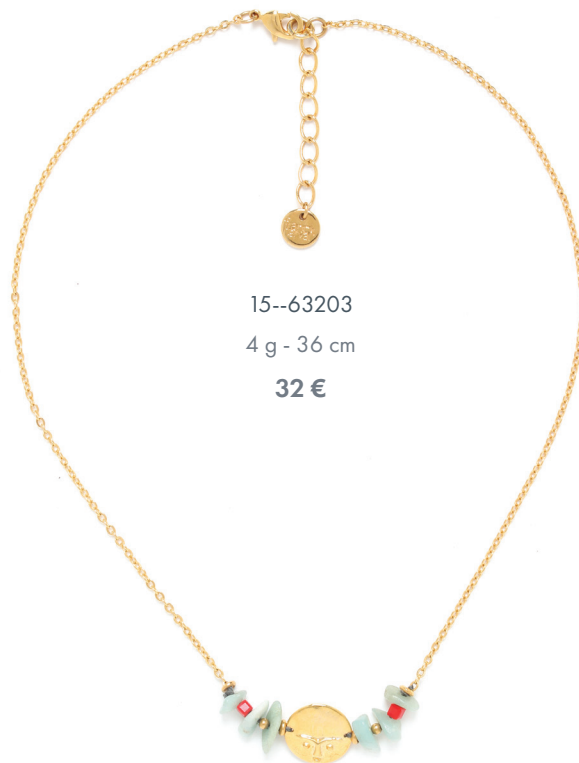
15--63203 4 g - 36 cm 32 €