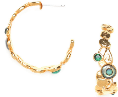
12--66258 Créole 9.5 g - 3 cm 55 €