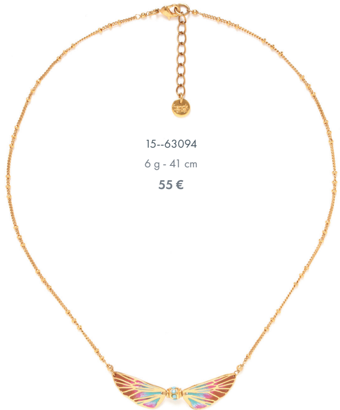
15--63094 6 g - 41 cm 55 €