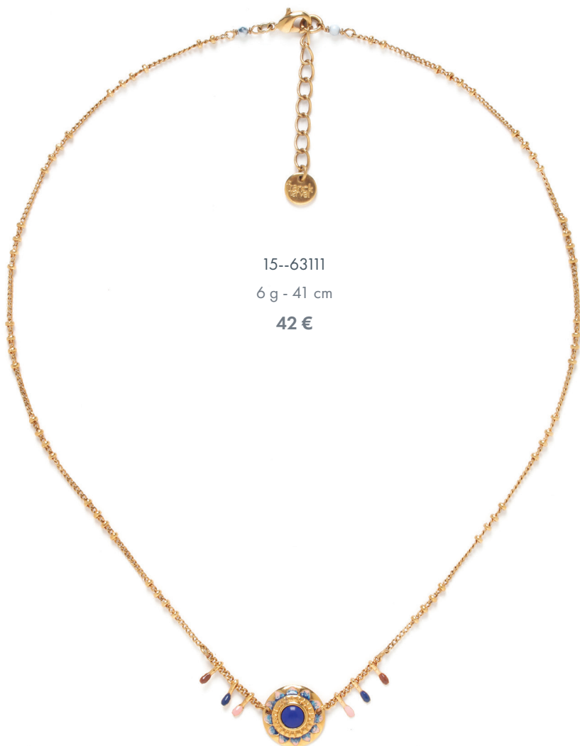
15--63111 6 g - 41 cm 42 €