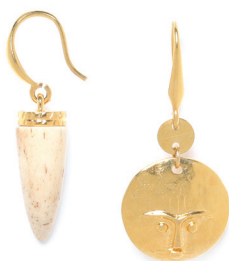
12--66520 Hook 4 g - 4 cm 42 €