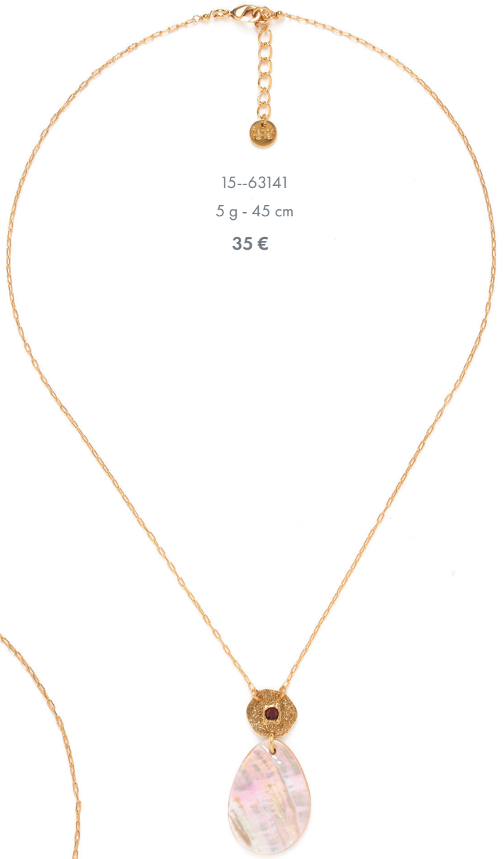
15--63141 5 g - 45 cm 35 €