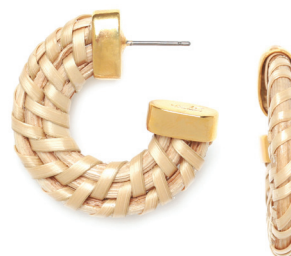
12--66486 Créole 5 g - 4 cm 35 €