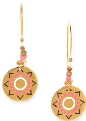
12--66503 Hook 4.5 g - 5 cm 35 €