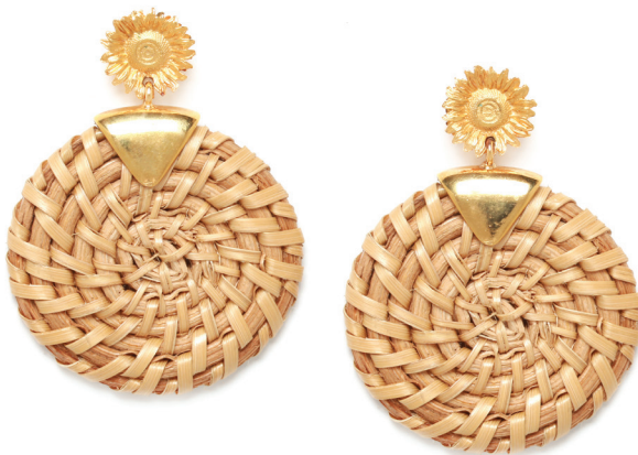
12--66485 Post 13 g - 6 cm 59 €