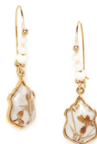
12--66367 Hook 2 g - 3.5 cm 42 €