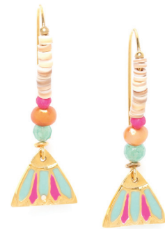
12--66561 Hook 4 g - 4.5 cm 35 €