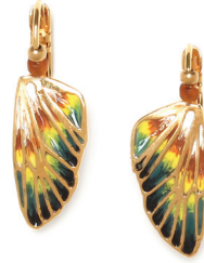
12--66260 Hook 3 g - 3 cm 42 €