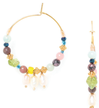
12--66543 Créole 6 g - 4 cm 39 €