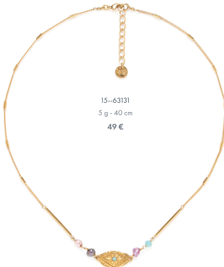
15--63131 5 g - 40 cm 49 €