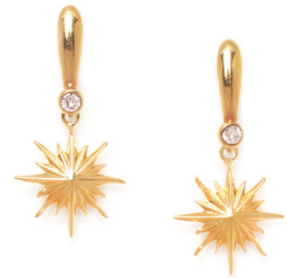
12--66286 Post 3 g - 2.5 cm 32 €