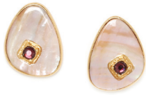
12--66390 Post 5 g - 2 cm 32 €