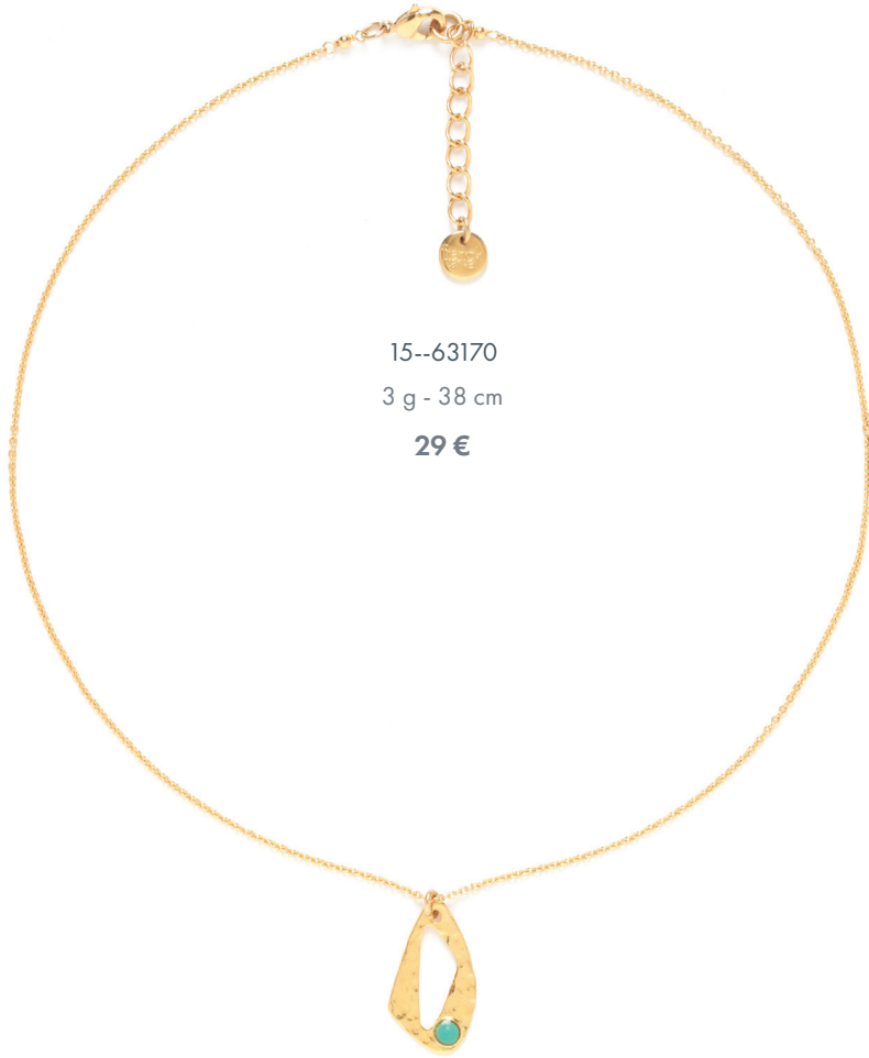
15--63170 3 g - 38 cm 29 €