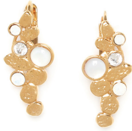
12--66250 Hook 5 g - 3 cm 42 €