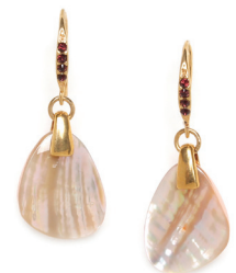
12--66397 Hook 3 g - 4 cm 39 €