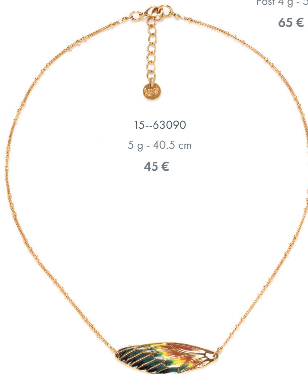
15--63090 5 g - 40.5 cm 45 €