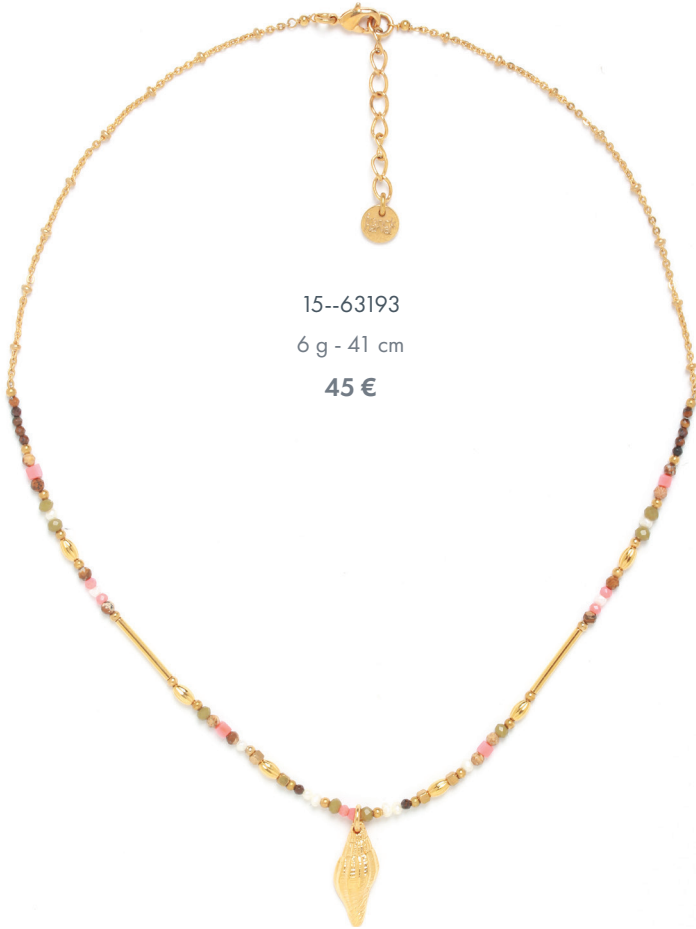
15--63193 6 g - 41 cm 45 €