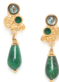
12--66255 Post 4 g - 3 cm 35 €