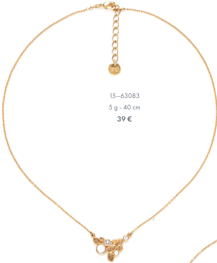
15--63083 5 g - 40 cm 39 €