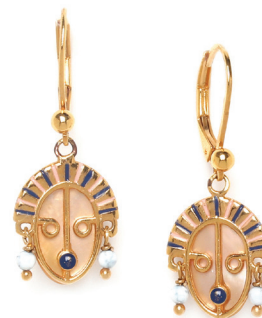
12--66327 Hook 3 g - 3.5 cm 42 €