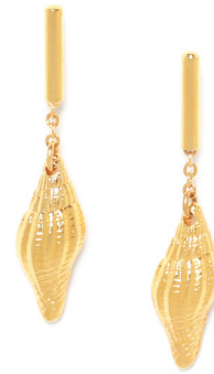
12--66507 Post 4 g - 4 cm 29 €