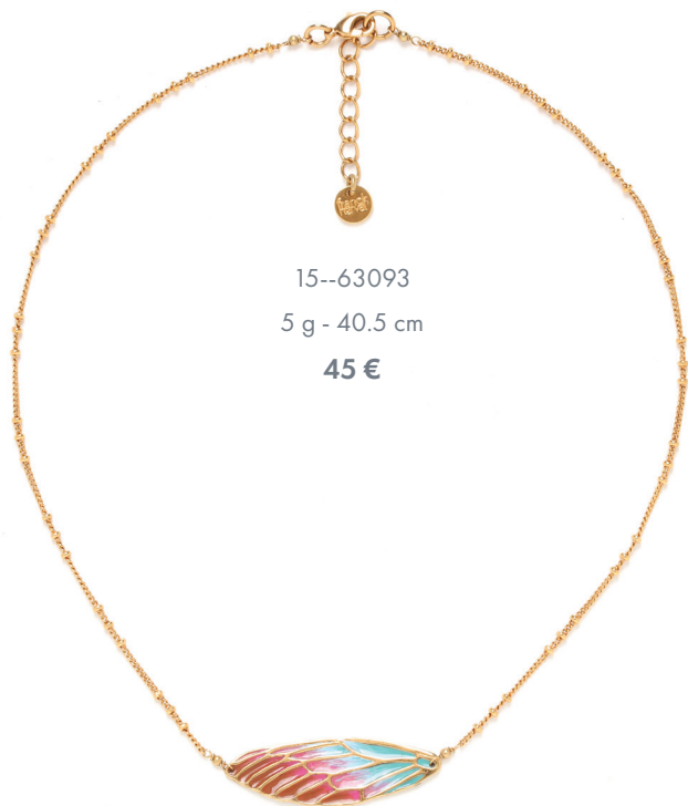
15--63093 5 g - 40.5 cm 45 €