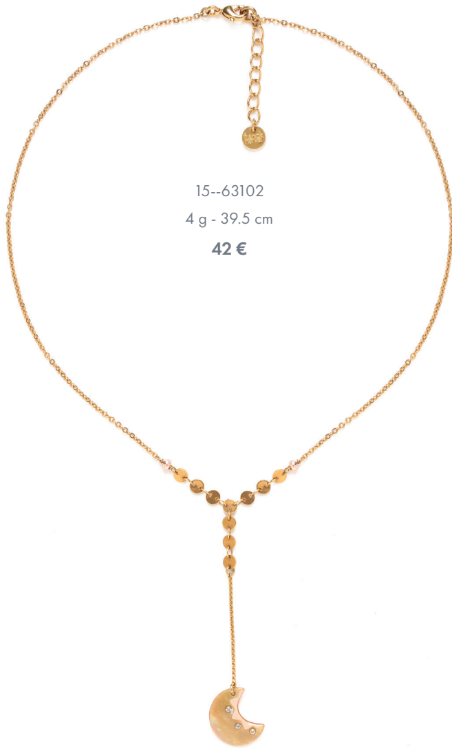
15--63102 4 g - 39.5 cm 42 €