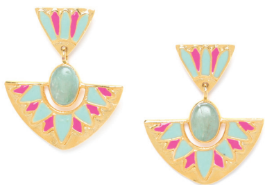
12--66568 Post 8 g - 3.5 cm 65 €