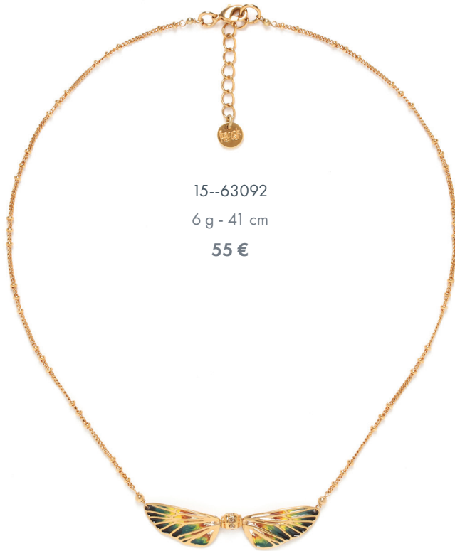
15--63092 6 g - 41 cm 55 €