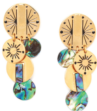
12--66440 Post 13 g - 5 cm 75 €