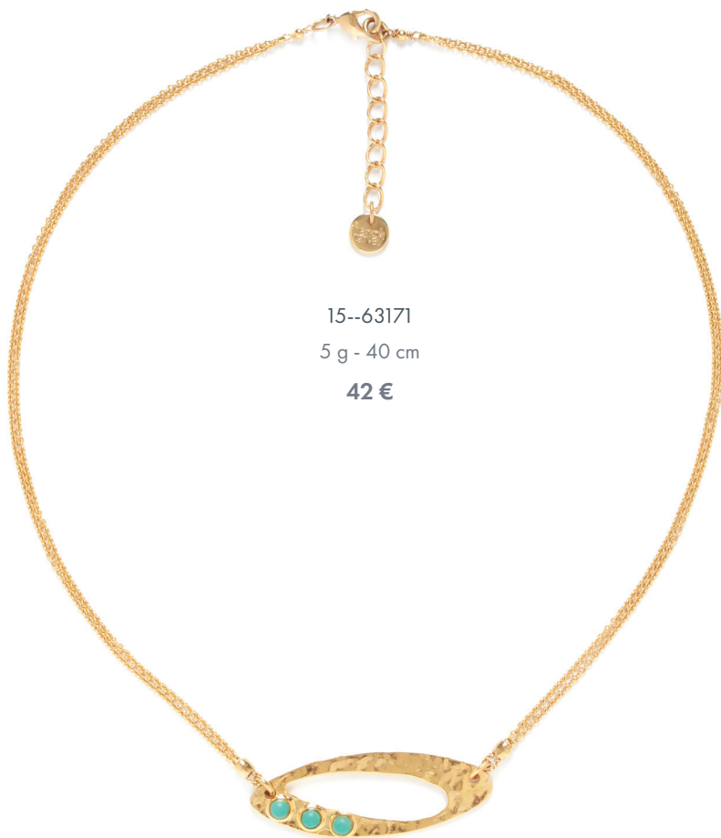
15--63171 5 g - 40 cm 42 €