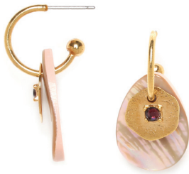
12--66393 Créole 6 g - 3.5 cm 45 €