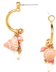
12--66505 Créole 7 g - 3 cm 49 €