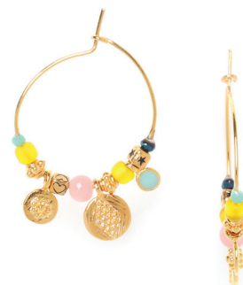
12--66545 Créole 5 g - 3.5 cm 42 €