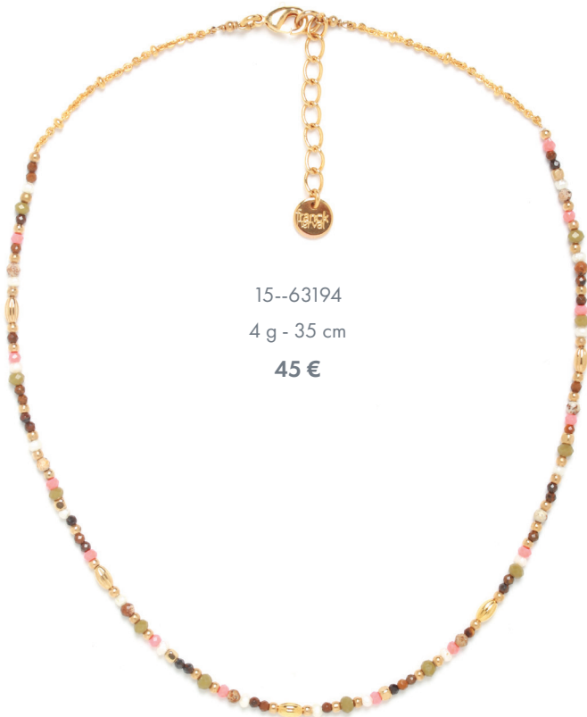
15--63194 4 g - 35 cm 45 €