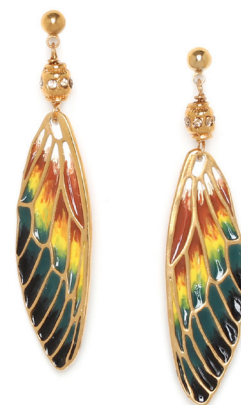
12--66261 Post 4 g - 5 cm 65 €