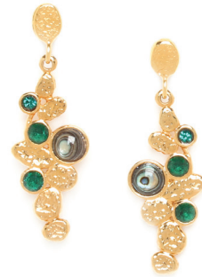
12--66341 Post 5 g - 3 cm 45 €