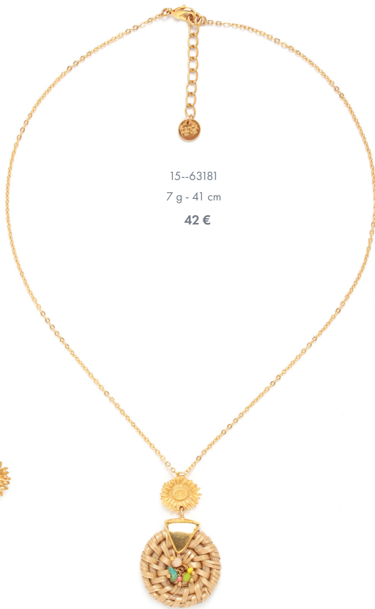
15--63181 7 g - 41 cm 42 €