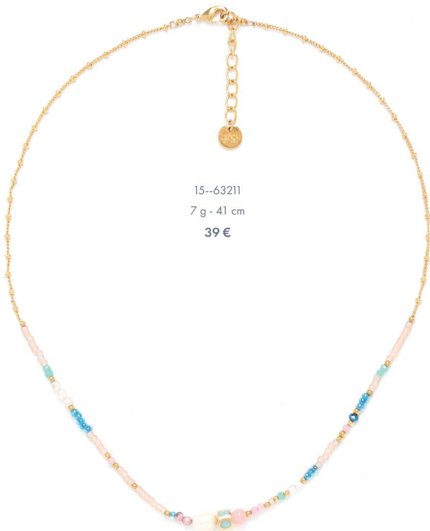
15--63211 7 g - 41 cm 39 €