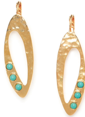
12--66462 Hook 5 g - 5 cm 39 €