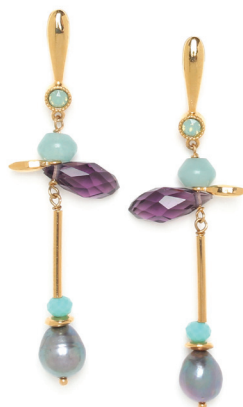
12--66372 Post 6 g - 6 cm 45 €