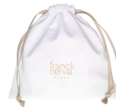
Bourse L Pouch L 905100201