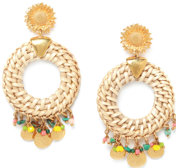
12--66487 Post 24 g - 8 cm 98 €