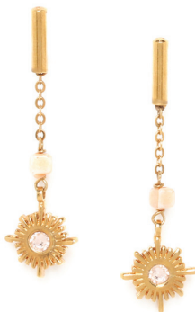
12--66281 Post 3 g - 4 cm 25 €