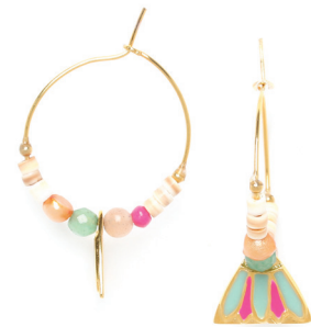
12--66567 Créole 4 g - 3.5 cm 39 €