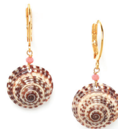
12--66506 Hook 3 g - 3 cm 29 €