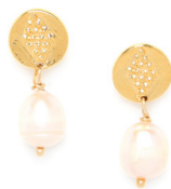
12--66540 Post 3 g - 2 cm 25 €