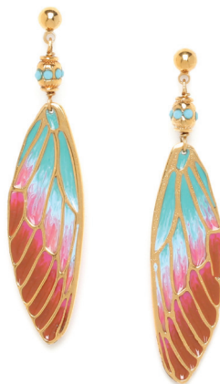
12--66267 Post 4 g - 5 cm 65 €