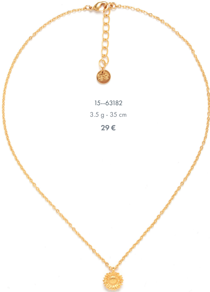
15--63182 3.5 g - 35 cm 29 €