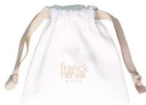
Bourse S Pouch S 905100204