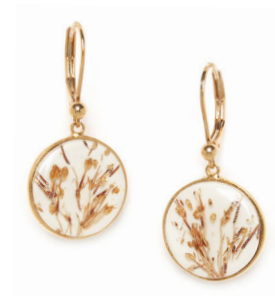
12--66366 Hook 4.5 g - 4 cm 32 €