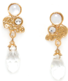
12--66247 Post 4.5 g - 3 cm 35 €