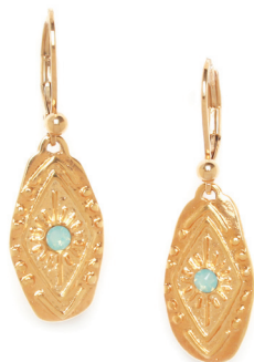
12--66370 Hook 6 g - 4 cm 35 €