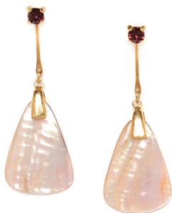
12--66395 Post 4.45 g - 4.5 cm 49 €