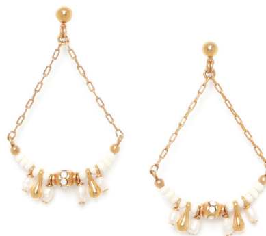
12--66369 Post 4.5 g - 4.5 cm 45 €