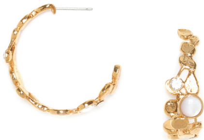
12--66245 Créole 10 g - 3 cm 55 €