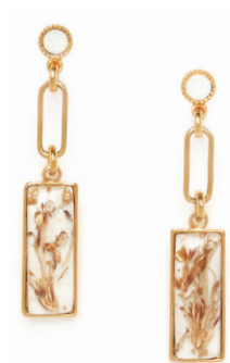
12--66363 Post 3.5 g - 4 cm 39 €