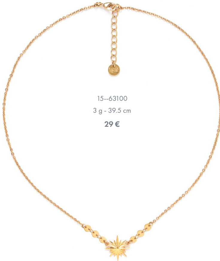
15--63100 3 g - 39.5 cm 29 €