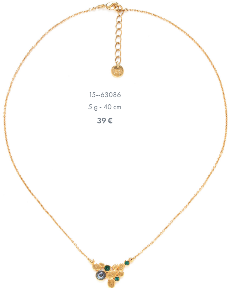
15--63086 5 g - 40 cm 39 €