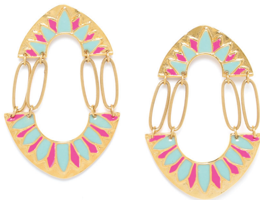
12--66566 Post 13 g - 5.5 cm 75 €