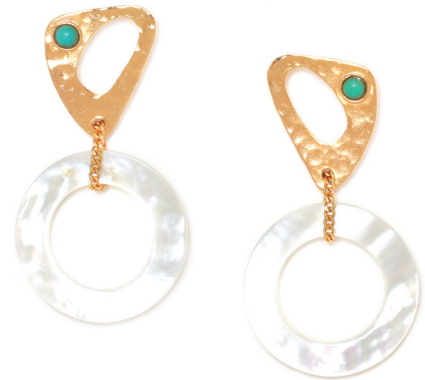
12--66463 Post 6 g - 4.5 cm 49 €