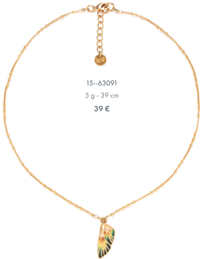
15--63091 5 g - 39 cm 39 €