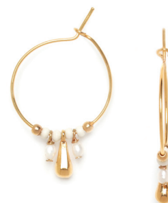
12--66411 Créole 2.5 g - 3 cm 25 €