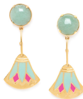
12--66564 Post 8.5 g - 4.5 cm 65 €