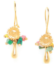
12--66480 Hook 3.5 g - 5 cm 35 €