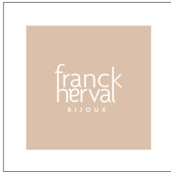
PLV institutionnelle Institutional Display 20x20cm