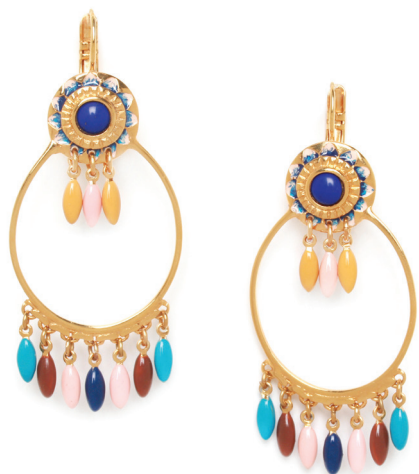
12--66330 Hook 9 g - 6 cm 75 €