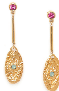
12--66375 Post 4 g - 4 cm 35 €