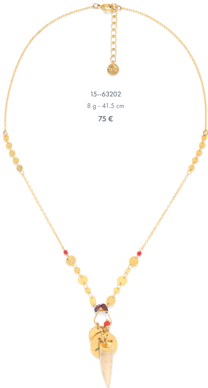
15--63202 8 g - 41.5 cm 75 €