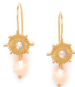
12--66280 Hook 4 g - 5.5 cm 25 €