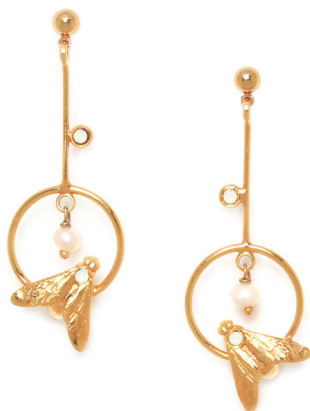
12--66360 Post 6 g - 5 cm 39 €