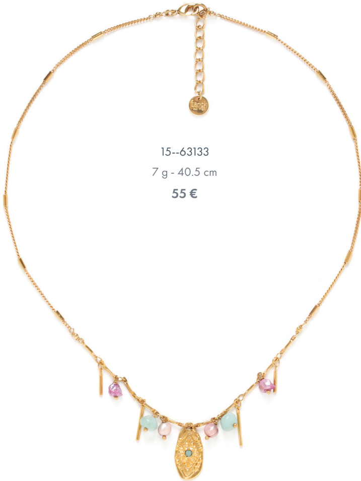
15--63133 7 g - 40.5 cm 55 €