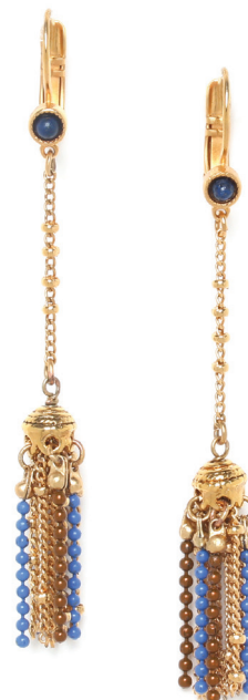
12--66325 Hook 6 g - 7 cm 45 €