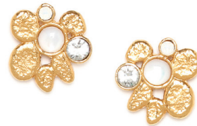
12--66249 Post 4 g - 2 cm 39 €