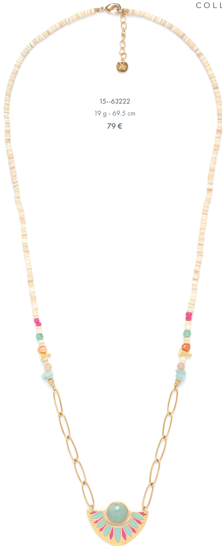
15--63222 19 g - 69.5 cm 79 €