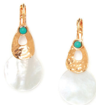
12--66465 Hook 5 g - 4 cm 42 €