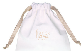
Bourse M Pouch M 905100200