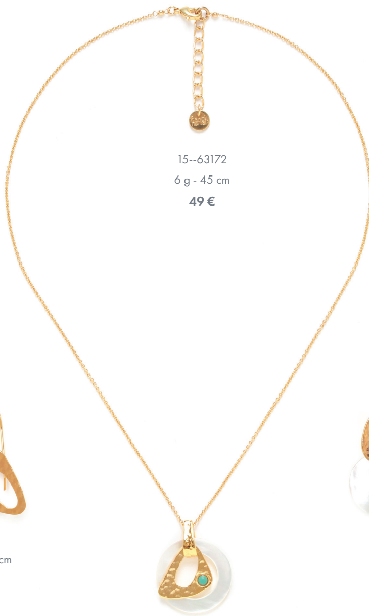
15--63172 6 g - 45 cm 49 €