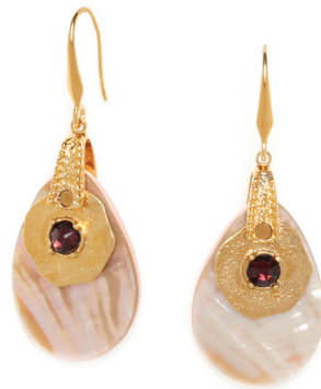
12--66394 Hook 8 g - 5 cm 59 €