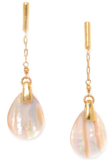
12--66392 Post 3 g - 5 cm 35 €