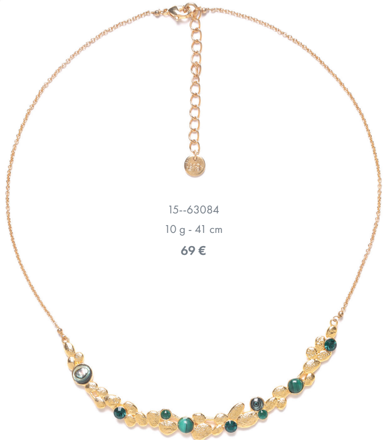
15--63084 10 g - 41 cm 69 €