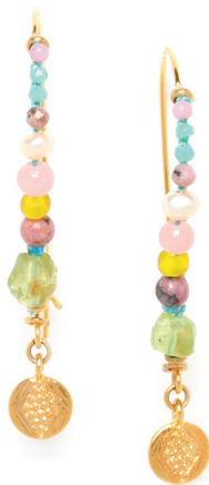
12--66542 Hook 4 g - 5.5 cm 35 €