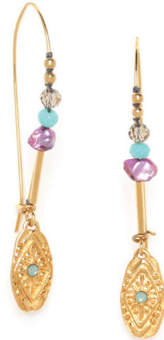
12--66376 Hook 4.5 g - 6 cm 32 €