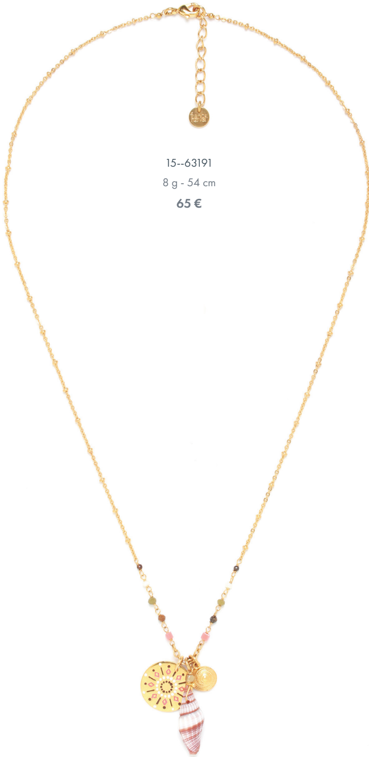
15--63191 8 g - 54 cm 65 €