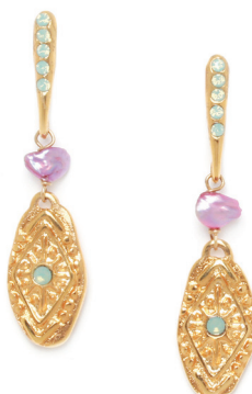
12--66371 Post 4 g - 4 cm 39 €