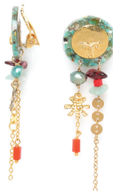
11--66522 Clip 7 g - 6 cm 79 €