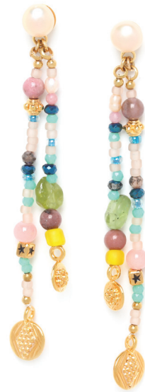
12--66544 Post 8 g - 7 cm 59 €