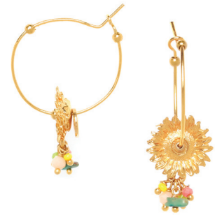
12--66484 Créole 5 g - 4.5 cm 39 €