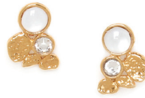
12--66248 Post 2 g - 1 cm 29 €