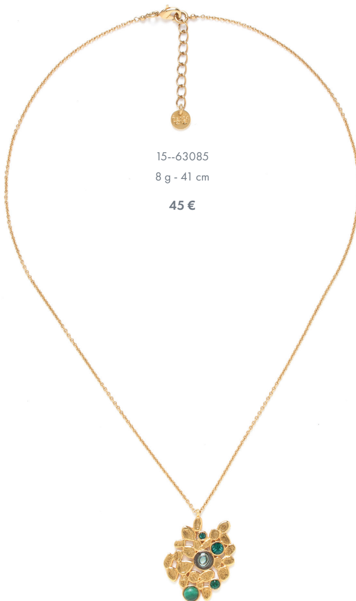
15--63085 8 g - 41 cm 45 €