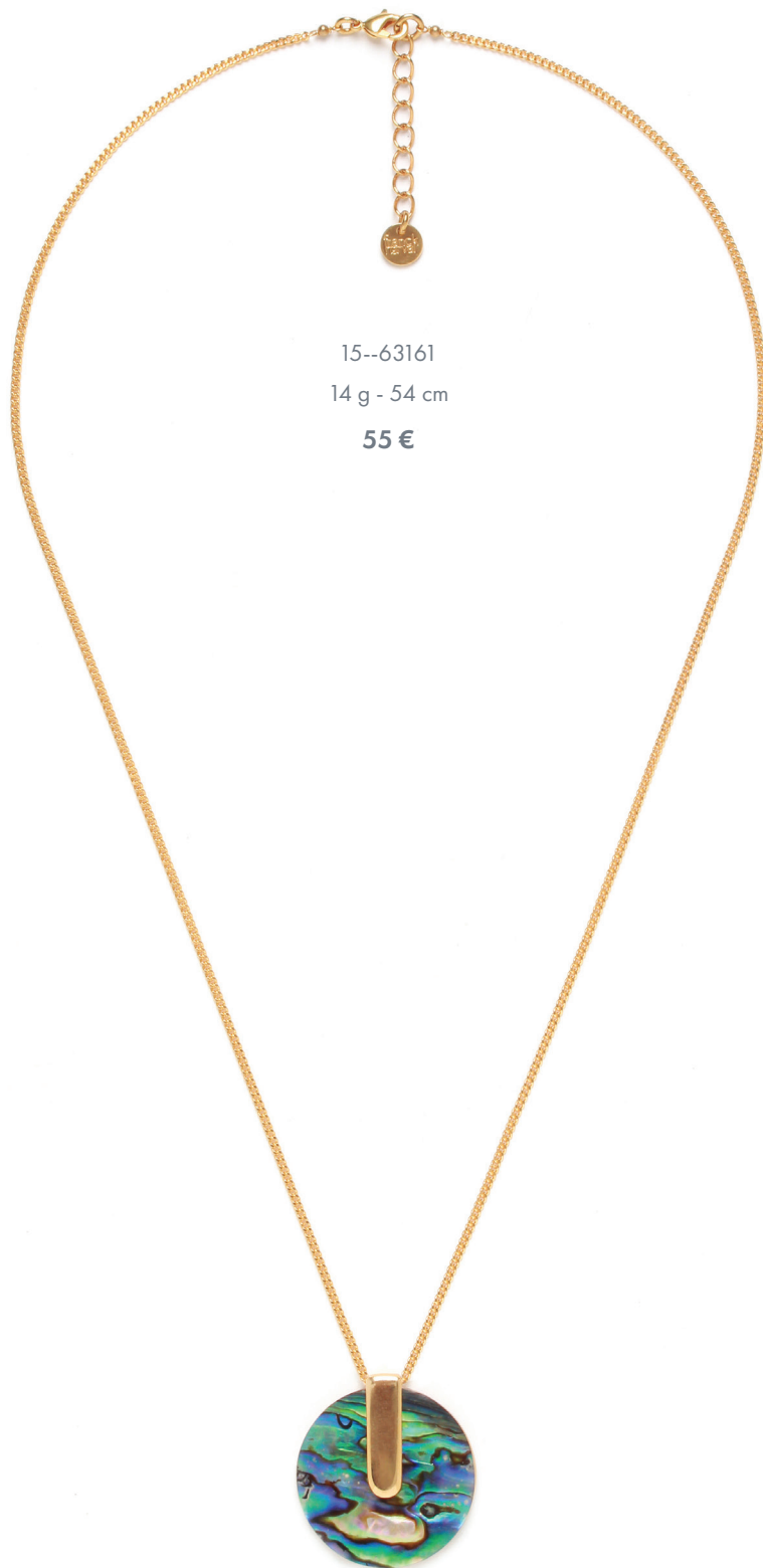
15--63161 14 g - 54 cm 55 €