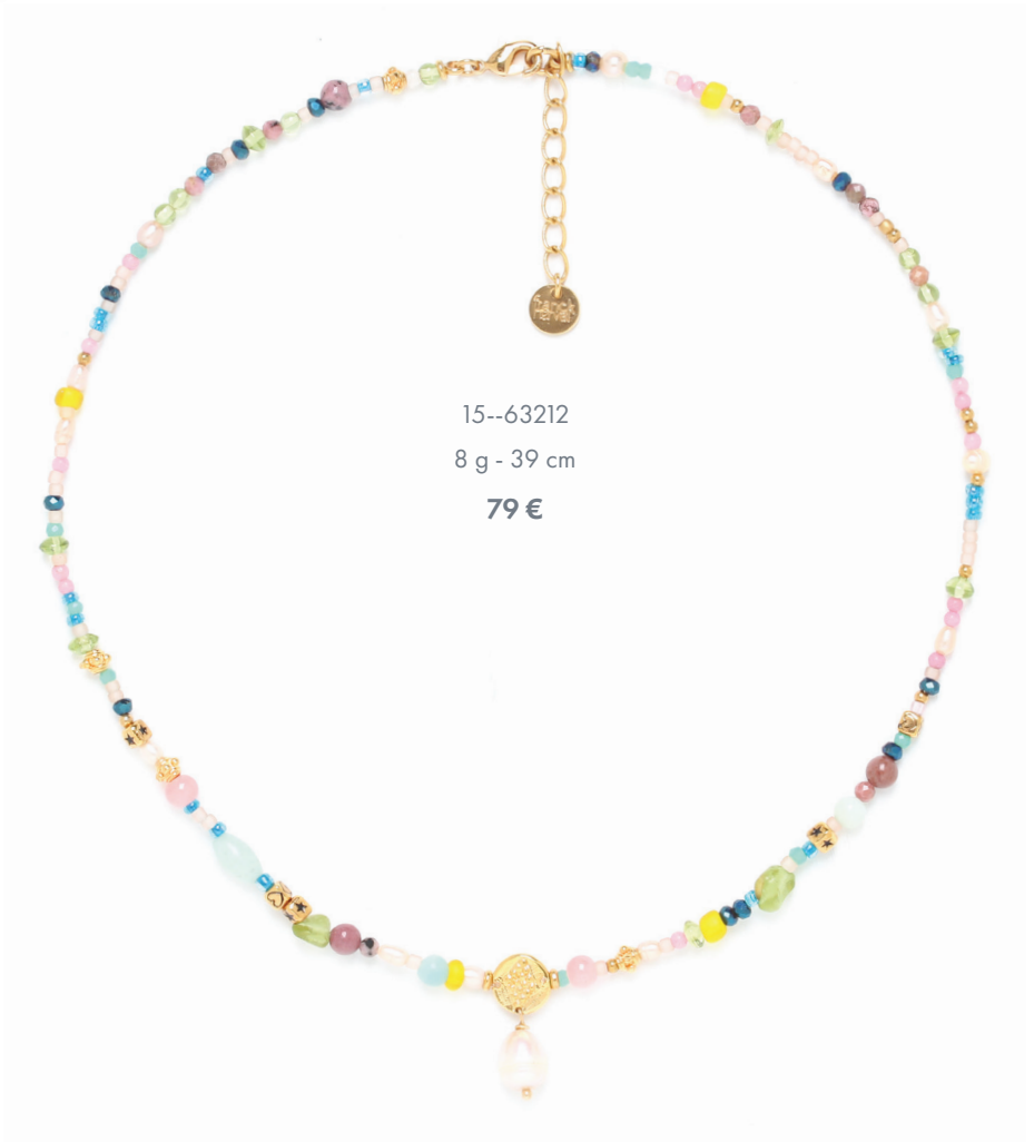
15--63212 8 g - 39 cm 79 €