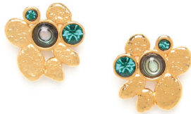
12--66256 Post 4 g - 2 cm 39 €