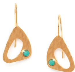
12--66461 Hook 2.45 g - 3 cm 25 €