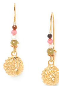
12--66501 Hook 3 g - 3 cm 25 €