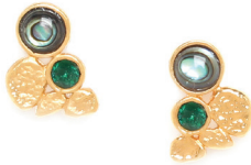
12--66340 Post 2 g - 1 cm 29 €