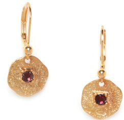
12--66399 Hook 3 g - 3 cm 25 €