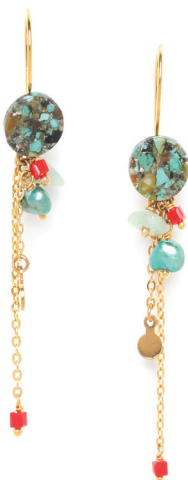
12--66527 Hook 3 g - 6.5 cm 45 €