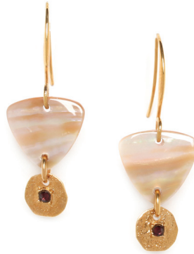
12--66391 Hook 3 g - 4.5 cm 39 €