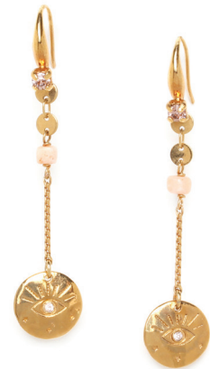
12--66282 Hook 4 g - 6 cm 39 €