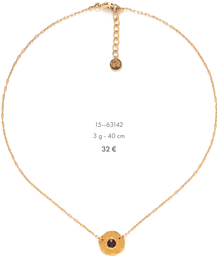
15--63142 3 g - 40 cm 32 €