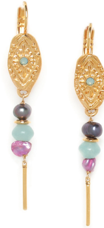
12--66374 Hook 6 g - 6 cm 39 €