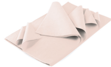
Papier de Soie Silk Paper 904100100