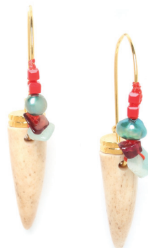
12--66521 Hook 6 g - 5 cm 49 €