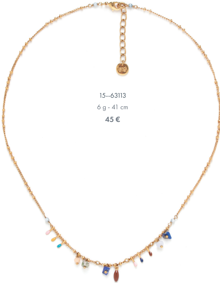
15--63113 6 g - 41 cm 45 €