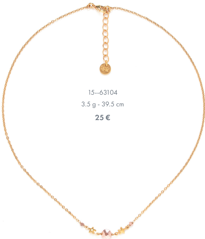
15--63104 3.5 g - 39.5 cm 25 €