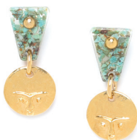
12--66525 Post 3 g - 2.5 cm 45 €