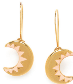
12--66285 Hook 3 g - 3 cm 22 €