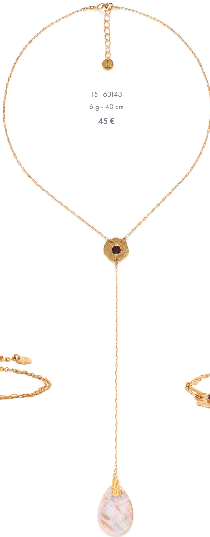
15--63143 6 g - 40 cm 45 €