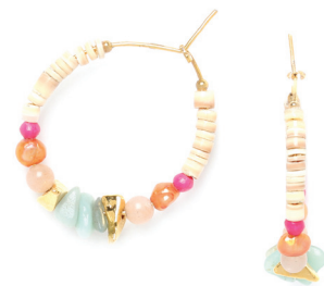
12--66560 Créole 6 g - 3 cm 35 €